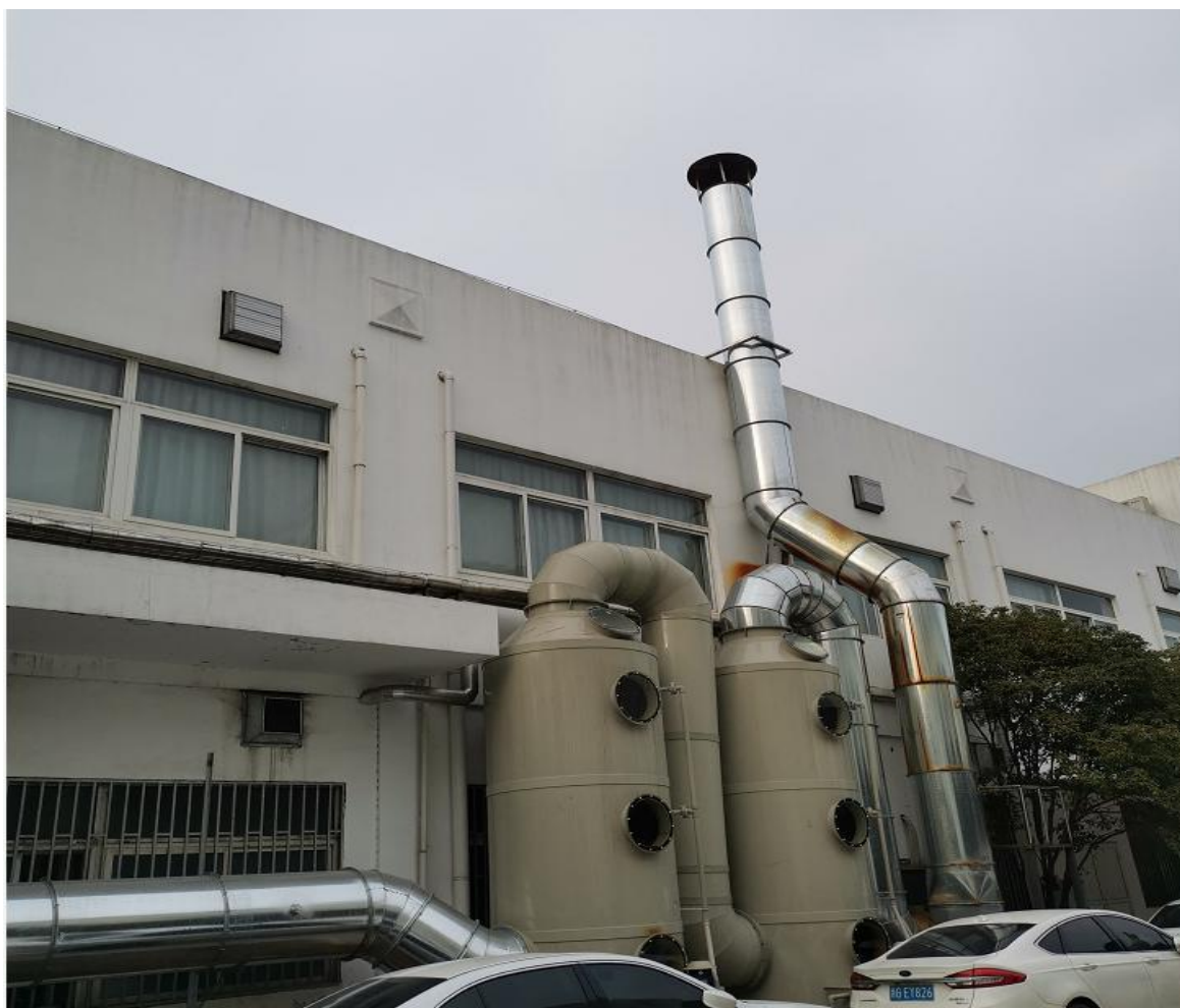
图 4-1 温浸全汁收稠异味处理装置现状图

2019 年 11 月企业对温浸全汁收稠异味经二级水喷淋+UV 光催化氧化三级废气处理后经 15m 高排气筒排放，具体处理装置见附图 4-1。