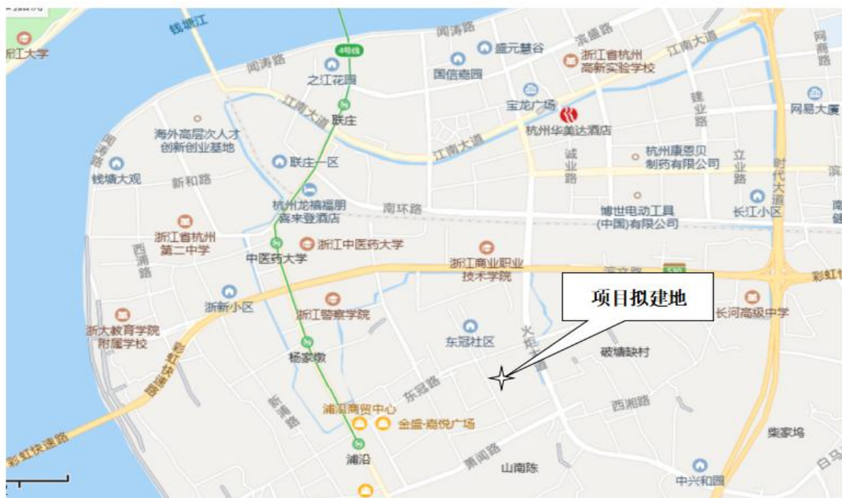
图3-1 项目具体地理位置图

杭州胡庆余堂天然食品有限公司改扩建项目选址位于杭州市滨江区浦沿街道园区中路10号。项目具体地理位置见图3-1，周围环境示意见图3-2。